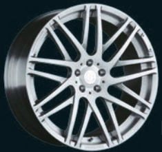
F BRABUS Monoblock F "PLATINUM EDITION" 21" /23"