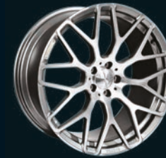
Y BRABUS Monoblock Y "PLATINUM EDITION" 21"/23"