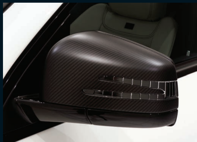
< BRABUS Carbon Spiegelkappen

BRABUS front lip and front bumper add-on parts carbon for GLE 63 Coupé