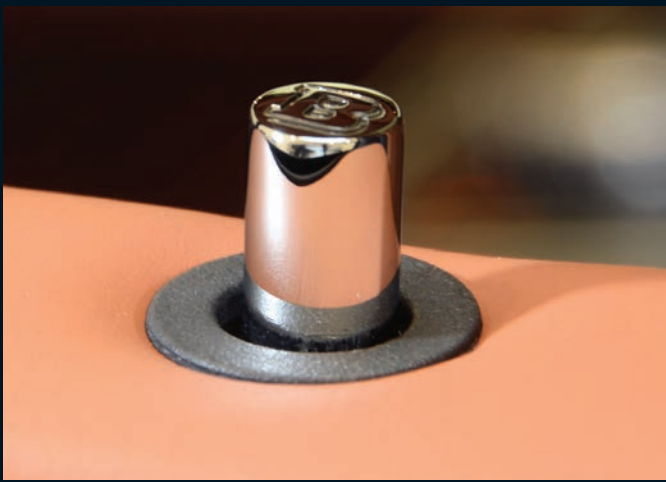
< BRABUS Türverriegelungsstifte