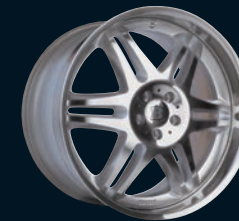
VI BRABUS Monoblock VI - evo "PLATINUM EDITION" 21"