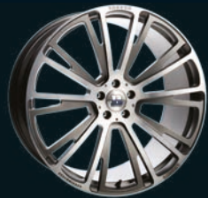
R BRABUS Monoblock R "PLATINUM EDITION" 21"/23"