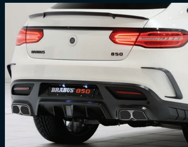
BRABUS rear diffusor carbon GLE 63 Coupé