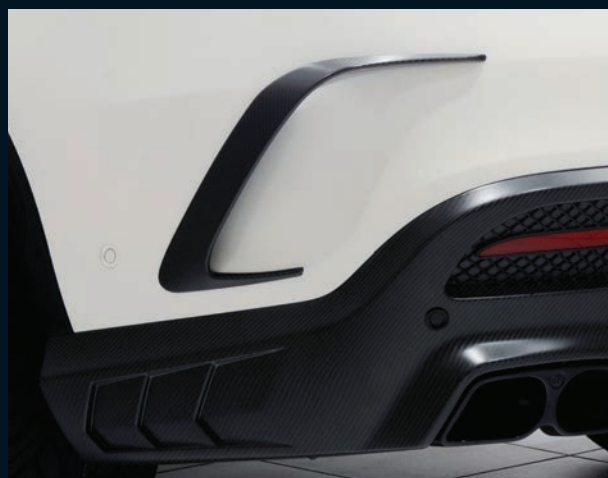
< BRABUS Heckschürzen- aufsätze Carbon GLE 63 Coupé