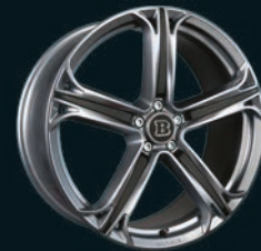
T BRABUS Monoblock T 22"