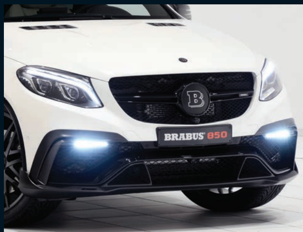
< BRABUS Frontlippe und Frontschürzenaufsätze Carbon für GLE 63 Coupé

BRABUS front lip and front bumper add-on parts carbon for GLE 63 Coupé