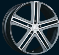
G BRABUS Monoblock G "PLATINUM EDITION" 22"