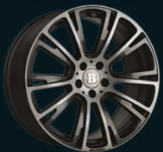
R BRABUS Monoblock R 20"/22"