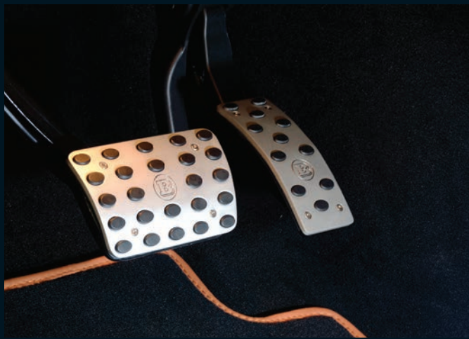
< BRABUS Aluminium Pedalauflagen