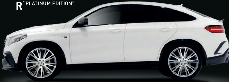
R "PLATINUM EDITION"